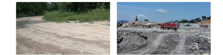
混合路况 恶劣路况