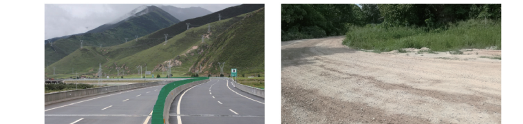
等级公路 混合路况