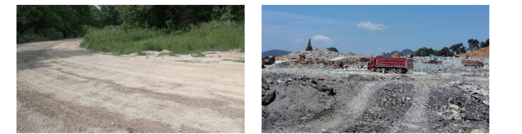
混合路况 恶劣路况