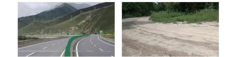
等级公路 混合路况