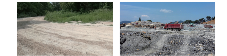
混合路况 恶劣路况